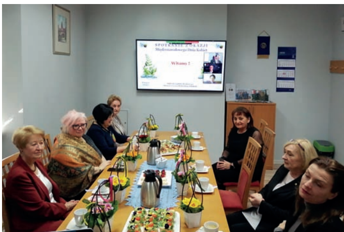
Spotkanie w sali prezydialnej OZW SEP z okazji Dnia Kobiet