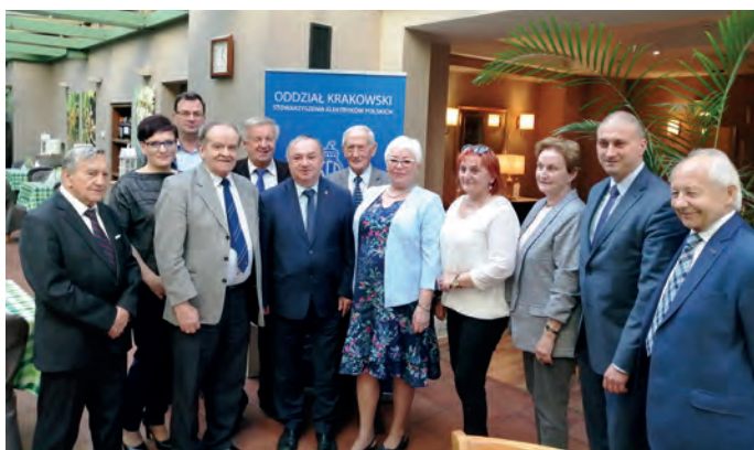
Fot. 5. Uczestnicy spotkania w Krakowie

▷ Spotkanie Prezydiów Oddziału Krakowskiego SEP i Oddziału Zagłębia Węglowego SEP w Krakowie.