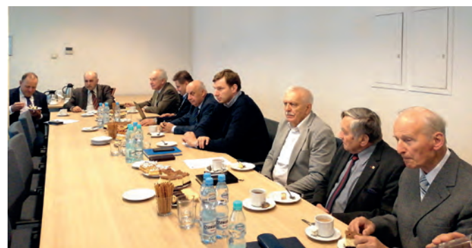
Fot. 8. Uczestnicy zebrania XI Zarządu OZW SEP