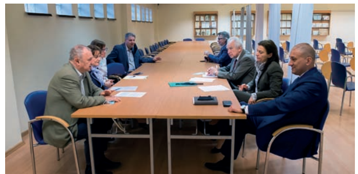
Posiedzenie Komitetu Organizacyjnego X KDE