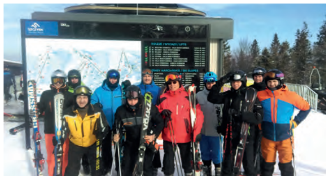
Fot. 7. Uczestnicy przed wyciągiem na Małe Skrzyczne

▷ Zarząd Koła SEP przy TAURON Wydobycie S.A. w Jaworznie zorganizował wyjazd narciarski dla członków Koła i sympatyków SEP do Szczyrku. W wyjeździe udział wzięło 19 osób. Piętnastu z nich eksplorowało stoki narciarskie, a czterech kolegów wybrało cieplejsze klimaty w AQAPARKU Leśna w Żywcu. W tym dniu, przy słonecznej pogodzie, mróz osiągnął minus 15 stopni. Na zakończenie imprezy wszyscy spotkali się w Karczmie „Ciosana” na ciepłym posiłku, po czym nastąpił powrót do Jaworzna.