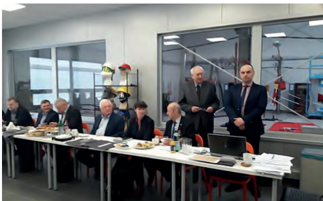
Fot. 2. Przedstawiciele PKBwE w trakcie obrad

▷ W Żabiej Woli w firmie HUBIX pod Warszawą odbyło się zebranie sprawozdawczo-wyborcze Polskiego Komitetu Bezpieczeństwa w Elektryce SEP.