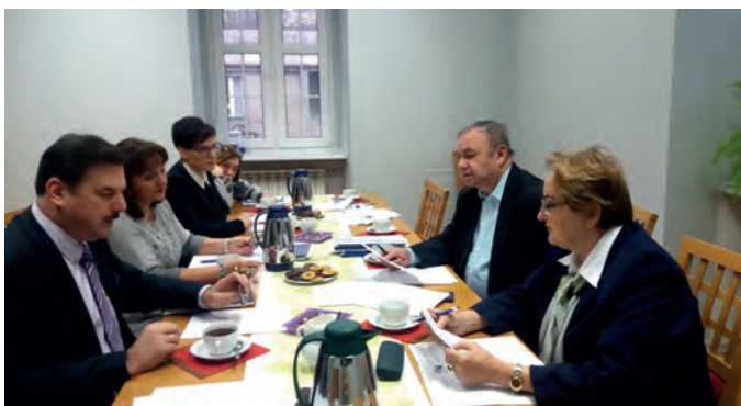
Fot. 11. Uczestnicy posiedzenia Prezydium OZW SEP

▷ W sali przydzielonej Oddziału odbyło się kolejne posiedzenie Prezydium OZW SEP. Omawiane były sprawy związane z organizacją Walnego Zgromadzenia Oddziału w siedzibie Instytutu Techniki Innowacyjnych EMAG w Katowicach.