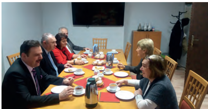
Fot. 3. Dyskusja przy pączkach