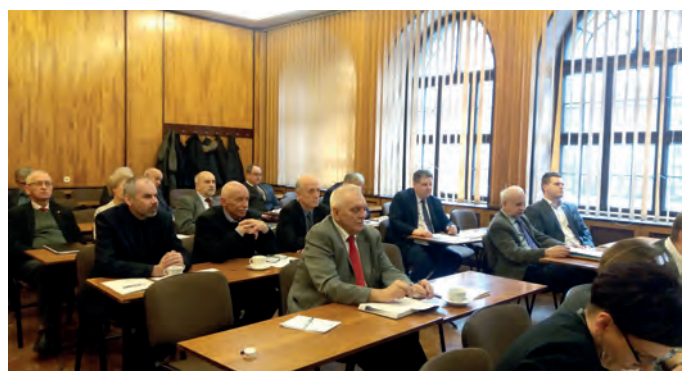
Fot. 16. Uczestnicy I Zebrania Zarządu OZW SEP