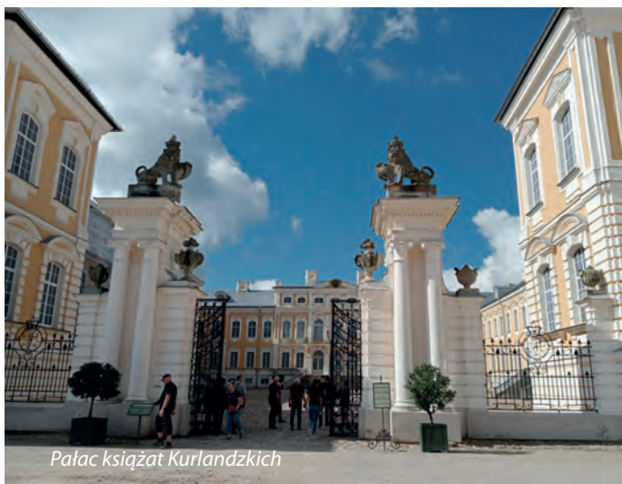
Pałac księżat Kurlandzkich

W godzinach porannych następnego dnia udajemy się do zakładu produkcyjnego firmy TAVRIDA ELECTRIC . Zwiedzamy zakład począwszy od biur projektowych po hale montażowe, gdzie zaznajamiamy się z budową rozdzielnic średniego napięcia z wyłącznikami próżniowymi. Te małogabarytowe rozdzielnice mogą być w przyszłości alternatywą dla rozwiązań z gazem SF 6 .