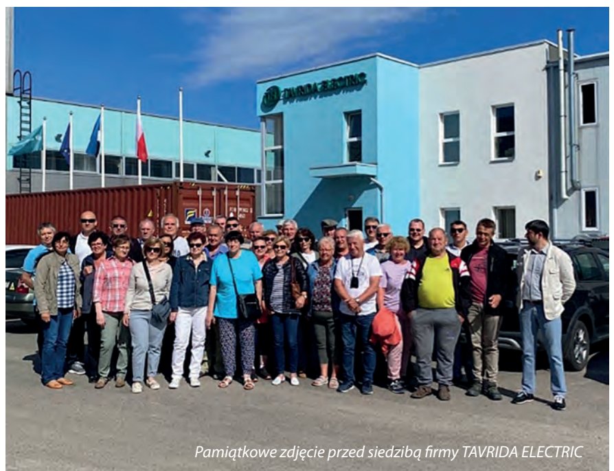
Pamiątkowe zdjęcie przed siedzibą firmy TAVRIDA ELECTRIC