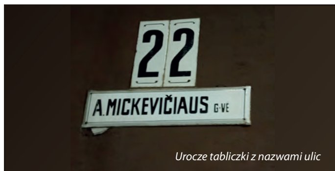
Uroczę tabliczki z nazwami ulic