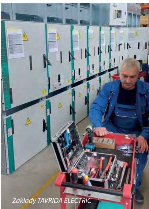
Zakłady TAVRIDA ELECTRIC

Kolejny dzień wycieczki to wyprawa promem do Helsinek. Po drodze zatrzymujemy się na wyspie, gdzie zwiedzamy twierdzę Suomenlinga (wpisaną na listę UNESCO). Jest to XVIII-wieczna forteca morska oraz obszar przyrodniczy z zabawkową artylerią i murami obronnymi.