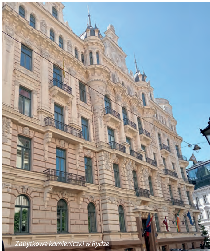
Zabytkowe kamieniczki w Rydze