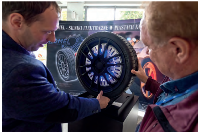
Stoisko reklamowe firmy ASTAT