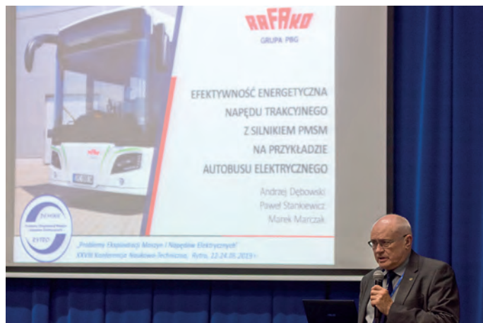
Sesja Elektromobilność gości na konferencji PEMINE od 2013 r.