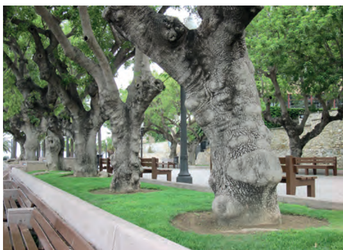
Fot. 6. III miejsce: „Stopy słonia” – Maria Kocjan

Wszyscy uczestnicy zgodnie wyrazili chęć wzięcia udziału w kolejnej wycieczce w przyszłym roku.