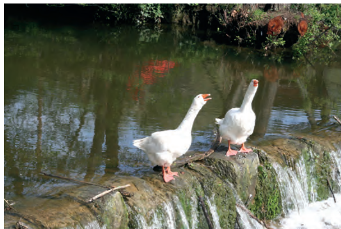
Fot. 5. II miejsce: „Rozmowy na wodospadzie” – Romana Kocjana