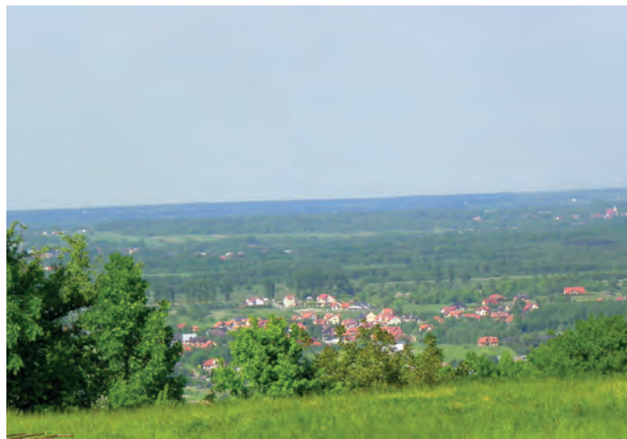
Fot. 9. Panorama Tarnowa – widok z Góry Św. Marcina

▷ 15-osobowa grupa SEP-owców Oddziału Gliwickiego uczestniczyła w wycieczce techniczno-krajoznawczej do Tarnowa. W godzinach przedpołudniowych uczestnicy wycieczki zwiedzili zakład produkcji paneli fotowoltaicznych BRUK-BET SOLAR , gdzie prześledzili cały ciąg technologiczny produkcji i montażu modułów fotowoltaicznych oraz ich badań.