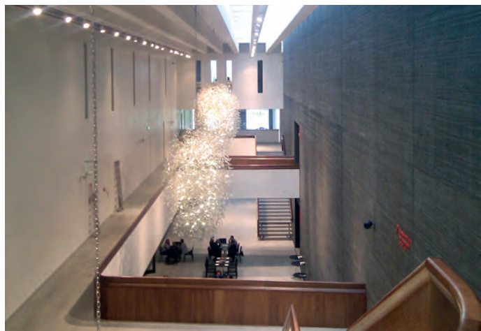
Fot. 10. Jeden z kilku olbrzymich ciągów komunikacyjnych w siedzibie NOSPR

W części krajoznawczej uczestnicy wycieczki zwiedzili m.in.: