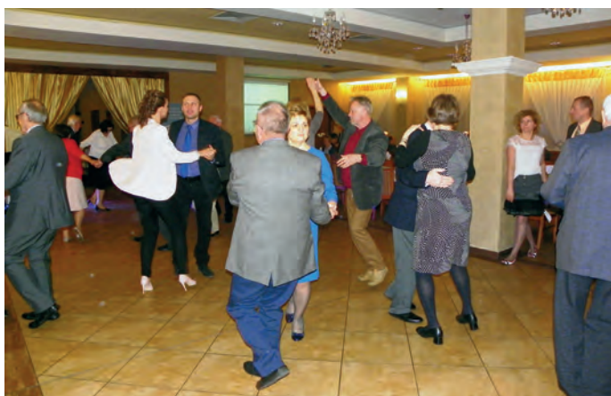
Fot. 2. Tylko kontuzjowani podpierali ściany...