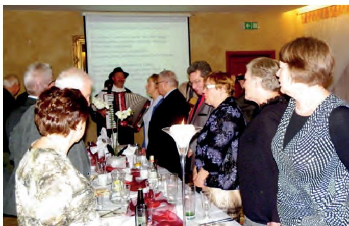
Fot. 1. Akordeonista wśród uczestników Biesiady

▷ W sali bankietowej restauracji „U Hrabiego” w Gliwicach (dawniej „MAG”) odbyła się tradycyjna, już XIII Biesiada gliwickich SEP-owców. W zabawie wzięło udział ponad 70 osób. Byli to członkowie Oddziału Gliwickiego SEP oraz osoby im towarzyszące. Jak zwykle dobre jedzenie, porywająca muzyka do tańca oraz śpiewy znanych i mniej znanych piosenek przy akompaniamencie dwóch gitar, akordeonu i skrzypiec spowodowały, że wszyscy bawili się wyśmienicie.