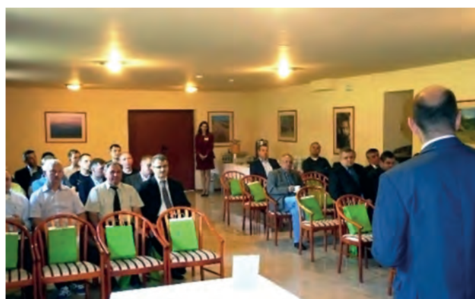
Fot. 3. Uczestnicy Seminarium w trakcie referatu

▷ W bieszczadzkiej miejscowości Hoczew odbyło się VII Seminarium Naukowe Koła nr 48 OGI SEP „Sterowanie, sygnalizacja oraz badanie maszyn i urządzeń elektroenergetycznych w przemyśle górniczym”. W programie Seminarium znalazł się dwudniowy cykl prezentacji technicznych i referatów o tematyce jak wyżej oraz zwiedzanie Zespołu Elektrowni Wodnych Solina-Myczkowce i okolicznych miejscowości wzdłuż tzw. małej pętli bieszczadzkiej.