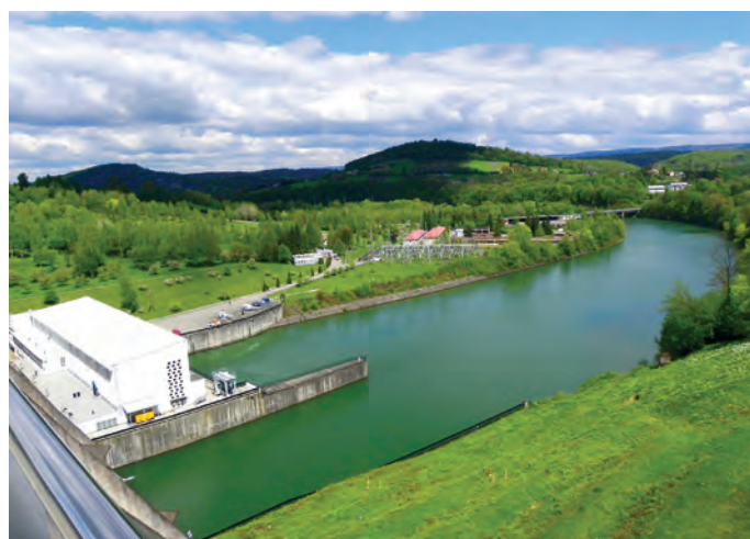
Fot. 4. Widok na San i fragment elektrowni w Solinie