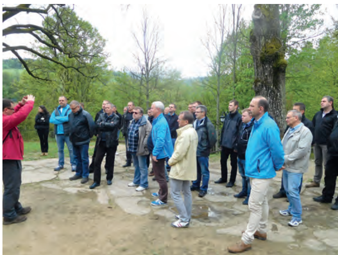
Fot. 5. ...a wilk był taki duży!!!