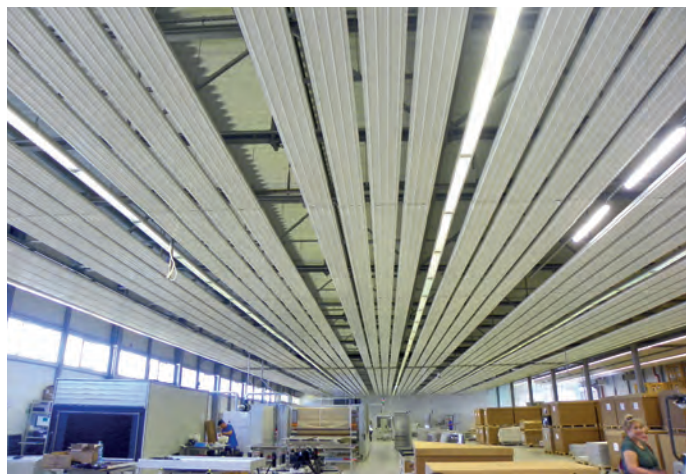
Fot. 8. Hala produkcyjna modułów fotowoltaicznych

▷ Liczna, bo aż 55-osobowa, grupa melomanów i całkowitych muzycznych dyletantów, członków Oddziału Gliwickiego SEP i osób towarzyszących, uczestniczyła w koncercie „Muzyki dawnej” w sali koncertowej Narodowej Orkiestry Symfonicznej Polskiego Radia w Katowicach.