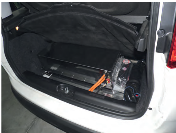
Rys. 6. Rozmieszczenie modułów 5 kWh baterii trakcyjnej w samochodzie osobowym z napędem E-Kit; od góry: w komorze silnika, zamiast zbiornika paliwa, w bagażniku

Bateria trakcyjna samochodu osobowego z napędem E-Kit złożona jest z trzech identycznych modułów bateryjnych A123, rozlokowanych w różnych miejscach samochodu (komora silnika przy podszyciu, zamiast zbiornika paliwa płynnego przed tylną osią i w tylnej przestrzeni bagażowej). Miejsca montażu dobrano tak, aby moduły bateryjne były możliwie najlepiej chronione przed skutkami kolizji. Każdy z modułów