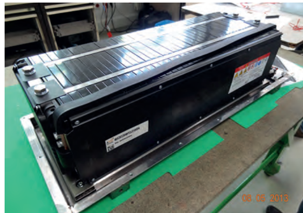
Rys. 5. Moduł baterijny firmy A123, z ogniwami pryzmatycznymi Li-ion nanofosfatowymi, o pojemności 5 kWh

Wg wielu ekspertów, z aktualnie dostępnych na rynku ogniw bateryjnych, ogniwa Li-ion nanofosfatowe A123 najlepiej spełniają wymagania stawiane bateriom trakcyjnym pojazdów elektrycznych. Główne ich zalety to: doskonała żywotność liczona w cyklach pełnego ładowania, wysoka wydolność energetyczna w szerokim zakresie stanu naładowania (ogniwo może dostarczyć 75% mocy znamionowej przy stanie jego rozładowania 90%), doskonała odporność na temperaturę otoczenia.