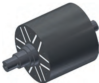
Rys.1. Wirnik z silnika IPMSM dla napędu E-Kit; na rysunku nie uwzględniono blach skrajnych w celu pokazania rozmieszczenia magnesów trwałych

Dla potrzeb finalnych wersji zestawów do elektryfikacji E-Kit zaprojektowano od podstaw dedykowany silnik synchroniczny z magnesami trwałymi (ang. skrót PMSM od Permanent Magnet Synchronous Motor). Zastosowano konstrukcję obwodu magnetycznego silnika z magnesami trwałymi mocowanymi wewnątrz rdzenia magnetycznego wirnika (ang. skrót Interior PMSM – IPMSM), z rozmieszczeniem magnesów każdego bieguna magnetycznego w kształcie litery V [1]. W przyjętej konstrukcji wirnika można wyróżnić dwie osie symetrii magnetycznej, oś podłużną d i poprzeczną q .