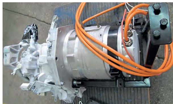
Rys. 2. Silnik IPMSM napędu E-Kit zmontowany z fabryczną skrzynią biegów samochodu osobowego

Silnik IPMSM jest zasilany w napędzie E-Kit z falownika energoelektronicznego firmy Sevcon , typ Gen4Size8. Jest to nowoczesny falownik dedykowany do zastosowań motoryzacyjnych. Falownik i silnik IPMSM napędu E-Kit są odpowiednio wzajemnie dopasowane pod względem prądowym, tzn. że wartości prądów znamionowego (ciągłego) i maksymalnego (dopuszczalnego chwilowego) falownika są bardzo zbliżone (nieznacznie większe) od wartości tych prądów dla silnika IPMSM.