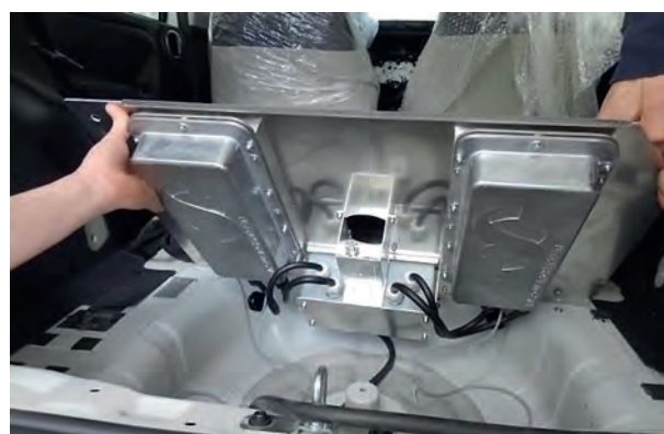
Rys. 7. Ładowarki baterii trakcyjnej zamontowano w przestrzeni koła zapasowego; zastosowano dwie ładowarki o łącznej mocy 6 kW

Łączna pojemność baterii trakcyjnej w samochodzie osobowym z napędem E-Kit wynosi 15 kWh (3 x 5 kWh). Napięcie znamionowe jednego modułu bateryjnego wynosi 85,8 V, a znamionowe napięcie szyny stałoprądowej pełnej baterii trakcyjnej U_{DC} = 257,4 \text{ V} .