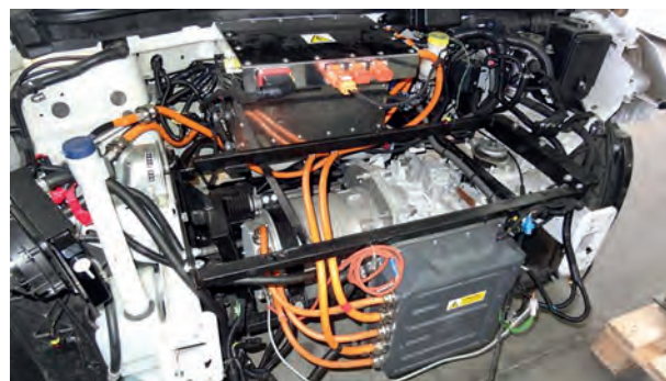
Rys. 3. Falownik Sevcon Gen4Size8 zamontowany w samochodzie osobowym, za nim widoczny silnik IPMSM i skrzynia biegów

Moce znamionowa i maksymalna falownika są wyższe niż wartości tych mocy osiąganych przez silnik napędu E-Kit w samochodzie osobowym. Wynika to z unifikacji rozwiązań napędów E-Kit zastosowanych w samochodach osobowym i dostawczym, gdzie m.in. zastosowano ten sam typ falownika i ten sam silnik IPMSM. Napęd E-Kit w samochodzie dostawczym osiąga jednak większe moce znamionową i maksymalną, o wartościach zbliżonych do odpowiednich mocy falownika Gen4Size8, a jest to związane z zastosowaniem w tym samochodzie wyższego napięcia U_{DC} na szynie stałoprądowej baterii trakcyjnej (przy tym samym znamionowym i maksymalnym prądzie I_{DC} ). Wyższe napięcie U_{DC} przekłada się na nieco inne charakterystyki elektromechaniczne: momentu na wale i mocy silnika w funkcji prędkości obrotowej wirnika, dla napędów E-Kit do pojazdów dostawczych, niż te pokazane na rysunku 4.